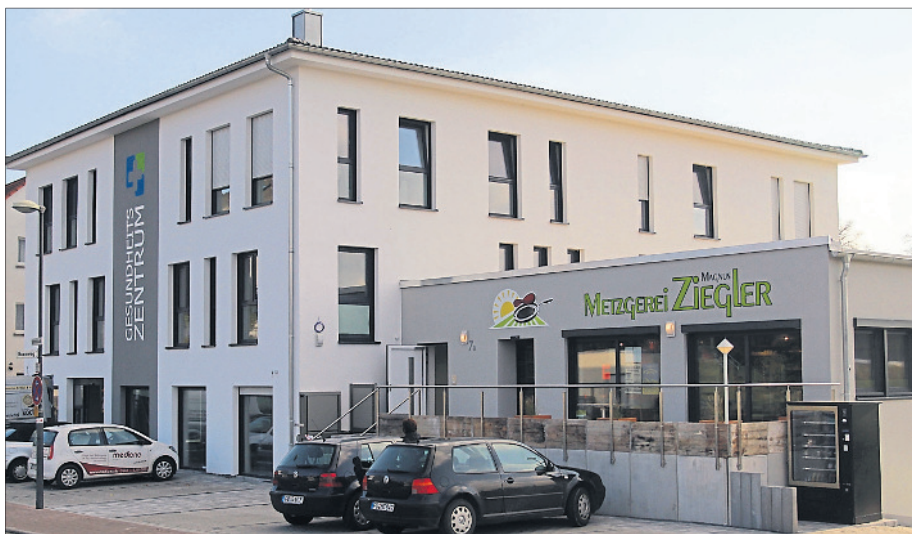
Am Freitag eröffnet das neue Gesundheitszentrum in Neuhof. Interessierte können ab 13.30 Uhr die Räume und Praxen besichtigen und die neue Mannschaft kennenlernen. Im Nebengebäude des Gesundheitszentrums kann man sich stärken.